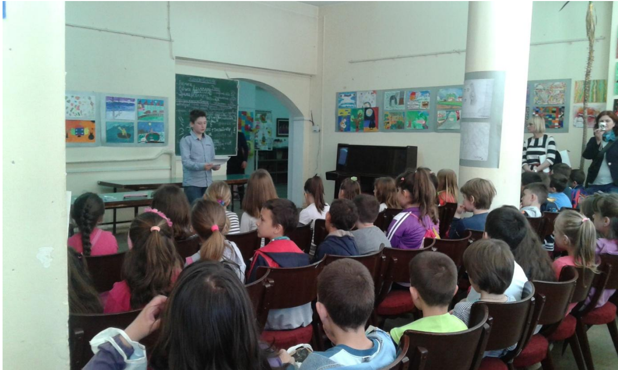
Детаљ са приредбе

30. 04. 2015. Поводом „Дана девојчица“. ученице обишле радне организације „Утензилија“, МТС, Фалке.