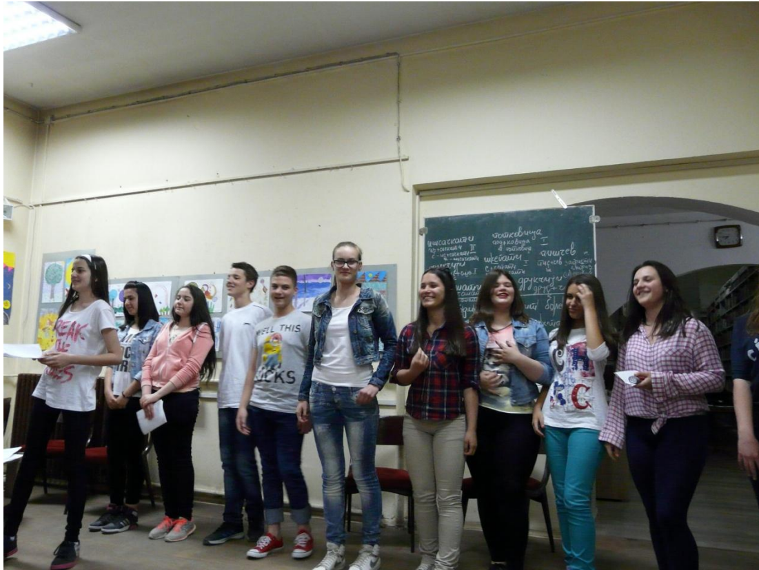
Детаљ са књижевне вечери

13. 05. 2015. Одржана је седница Школског одбора.