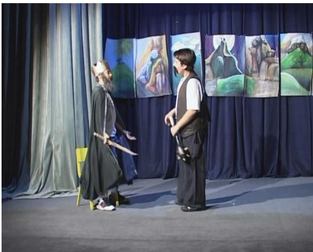
Детаљи са представе Марко Краљевић и Муса Кесеџија

12. 06. 2015. Ученици су организовано присуствовали позоришној представи „Капетан Џон Пиплфокс“ у Народном позоришту у Лесковцу.